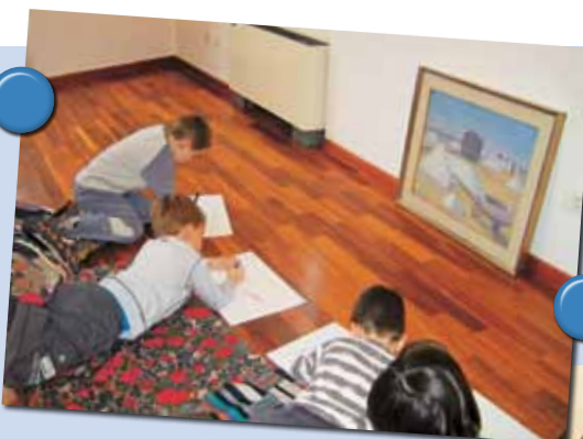
Otroci slikajo kupe soli na Sečoveljskih solinah. Otroci pred Pečaričevimi upodobitvami oljčnih gajev.