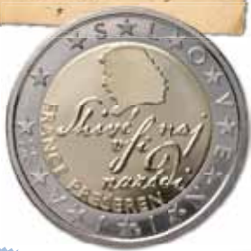
Portret Franceta Prešerna z začetnim verzom Zdravljice na slovenskem kovancu za 2 EUR.

Ob kulturnem prazniku, ko se po Sloveniji zvrstijo številni kulturni dogodki in proslave, so učenci OŠ Marezige obiskali razstavo v koprski Galeriji Meduza.