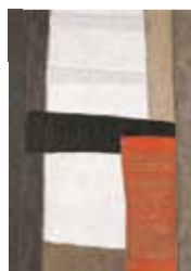
SLIKA: LOJZE SPACAL

Nekoliko nenavadno je, da v galeriji razstavljamo stole. Toda mlada primorska arhitektka Tina Cotič jih je oblikovala tako, da so zagotovo vredni ogleda. Grafike priznanega umetnika Lojzeta Spacala (1907–2000) so jo z motivi, kompozicijami, barvami in simboli tako očarale in navdihnile, da jih je želela opredmetiti. Uporabni predmet je z njeno idejo in ustvarjalnostjo postal pravi umetniški objekt.