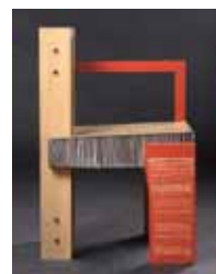
STOL: TINA COTIČ