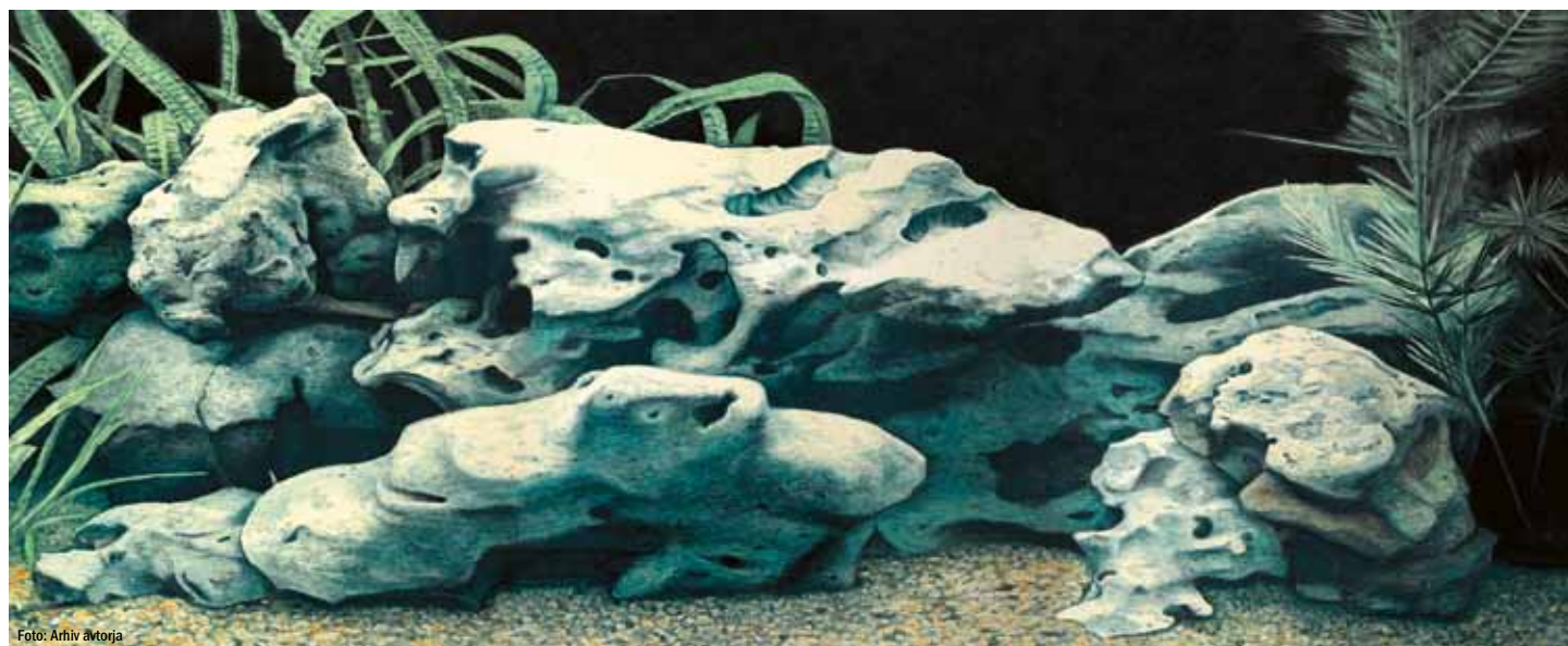
Velika akvarijska pokrajina , 2009, olje na platnu, 180 x 450 cm