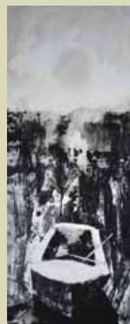
V mandraču, 2011, monotipija, 70 x 30 cm