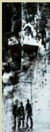
Benečanka, 2011, monotipija, 70 x 30 cm

Dušan Sterle sodi med tiste likovnike, ki se redno udeležujejo Mednarodnega slikarskega ex-tempora Piran. Na tokratni samostojni razstavi pa bomo spoznali še njegovo grafično ustvarjanje: prvič bo javnosti predstavljen opus monotipij iz letošnjega leta, tematsko vezanih na Piran. Motivi so kljub shematizaciji upodobljenega vedno prepoznavni: sledimo različnim izsekom starega mestnega jedra, v katere pogosto umešča človeške figure, in drugim tipičnim prizorom iz obmorskega ambienta. Kljub uporabi grafične tehnike, delujejo bogato niansirane podobe v asketski izbiri ene barvne vrednosti, zelo slikarsko. Upodobitve preveva posebna atmosfera miru, tišine, spokojnosti, očitno pogojena z avtorjevim doživljanjem obmorskega mesta, ki ga sicer redno obiskuje. ■ Nives Marvin