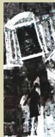
Piransko okno, 2011, monotipija, 70 x 30 cm